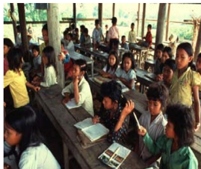
Школьный класс в Камбодже, 1994

П раво на образование является одним из основополагающих прав, за обеспечение которых борется ЮНЕСКО. Тем не менее, много детей со всего мира еще далеки от школьных скамеек (103,5 млн. в 2001 г.), и более 800 миллионов взрослых – неграмотны, из них 64% – женщины. Перед лицом этой ужасной статистики международное сообщество поручило ЮНЕСКО, имеющей большой опыт уже проведенных мероприятий в области образования, заняться координацией амбициозного проекта «Образование для всех (ОДВ) к 2015 году» и поддерживать коллективную динамику, царившую на Всемирном форуме по образованию в Дакаре (Сенегал) в апреле 2000 г. Чем обусловлен этот приоритет? С момента