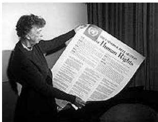
Элеонора Рузвельт с Всеобщей декларацией прав человека.