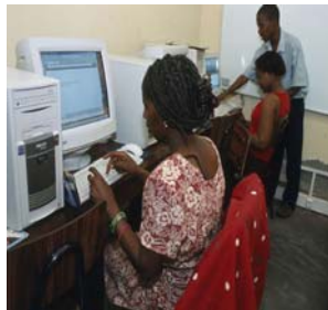
Telecentro de Manhica, Mozambique, 2004

La revolución de la información, así como la revolución digital, que dieron comienzo en los Estados Unidos de América y algunos países de Europa del Norte, antes de propagarse por el resto del mundo, distan mucho de haber culminado todavía. El saber, vector de la productividad y el crecimiento económico, está cada vez más codificado y se transmite con creciente frecuencia por conducto de redes informáticas y de comunicación en la nueva "sociedad del conocimiento". Las tecnologías de la información y la comunicación (TIC) constituyen un conjunto de instrumentos cada vez más eficaces para crear y difundir el conocimiento, así como para aprovecharlo en común. Para el éxito de las personas en la vida, las competencias en la utilización de la informática son tan esenciales como los conocimientos básicos en lectura, escritura y cálculo.