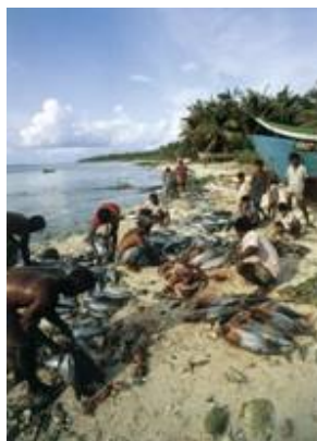
Village de pêcheurs

Les petits États insulaires en développement (PEID) dispersés dans les océans Atlantique, Pacifique et Indien, ainsi que dans les mers des Caraïbes et Méditerranée, forment des groupes distincts. Chacun d'entre eux a ses caractéristiques propres, toutefois, leurs points communs sont nombreux. Si l'on considère qu'ils font partie des pays les plus riches au monde en termes de diversité biologique et culturelle, ils n'en demeurent pas moins extrêmement vulnérables. Ils doivent surmonter de nombreuses difficultés, liées notamment à la taille réduite de leur territoire, à l'étendue de leurs zones économiques exclusives, à leur vulnérabilité vis-à-vis des risques et catastrophes naturels, à leurs ressources naturelles limitées, à leur