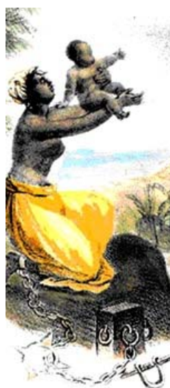
Ты вырастешь свободным, мой сын!

внимания общественности, по развитию научных исследований, публикации печатной продукции и производству педагогических аудио- и видеоматериалов в ряде стран. Одним из самых серьезных достижений проекта является внесенный им вклад в признание Всемирной конференцией против расизма, расовой дискриминации, ксенофобии и нетерпимости (Дурбан, Южная Африка, 2001г.) работорговли и рабства «преступлением против человечества». С самого начала работа по проекту велась по пяти взаимосвязанным направлениям: научно-исследовательская работа; образовательная программа; сохранение исторических мест, объектов и построек, сбор и сохранение рукописей и устных традиций; распространение знаний о вкладе африканской диаспоры, в особенности, в области культурных традиций, художественного и духовного творчества.