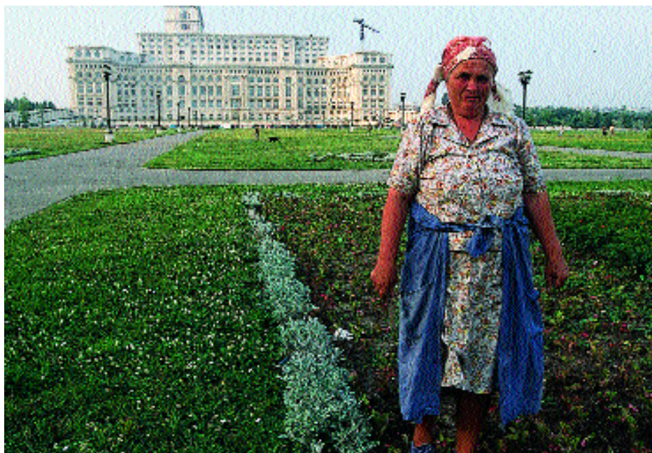
Sur les quelque 26 millions d'emplois supprimés en Europe de l'Est depuis 1989, environ 14 millions étaient occupés par des femmes. Retour aux champs pour certaines, comme ici, en Roumanie.