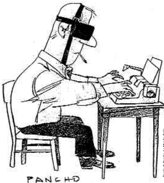
Dessin © Pancho, Le Monde, Paris

La conférence de La Baule, en 1990, invite les pays francophones africains à libéraliser leurs régimes. En 1991, les pays anglophones réunis pour la conférence du Commonwealth à Harare (Zimbabwe), font de même et décident l'exclusion de toute nation qui ne s'ajusterait pas à la nouvelle donne. Ce qui est le cas du Nigeria, le plus grand pays