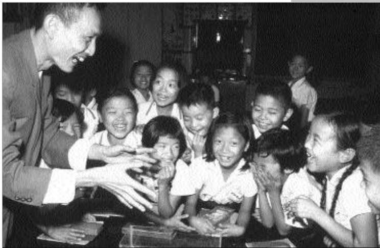
L'un des soucis de la réforme chinoise, décompresser les jeunes