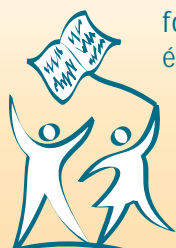
En rapprochant écoles communautaires et villages, l'Egypte a montré comment donner accès à l'éducation aux filles des zones défavorisées.