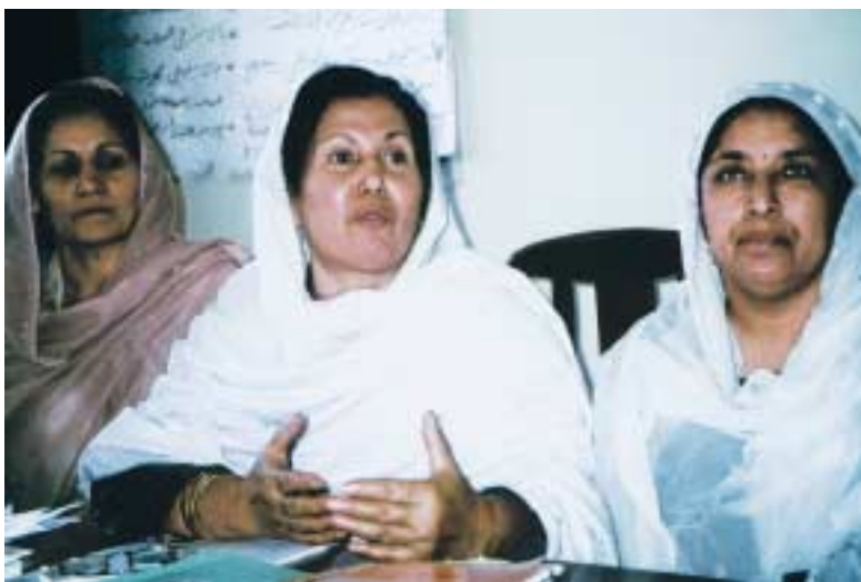
Classe d'alphabétisation pour femmes à Kaboul en Afghanistan, 2002

Dans le cadre d'un partenariat avec le Bureau UNICEF de Kaboul, l'IUE favorise dans ce pays le développement de capacités en alphabétisation et éducation non formelle pour tous. Après 23 ans de conflits armés, le taux d'alphabétisation en Afghanistan figure parmi les plus bas de la planète. Selon les statistiques disponibles, seulement 5 % des Afghanes sont lettrées. Sous le régime taliban (1995-2001), les filles et les femmes en particulier étaient privées d'éducation. L'IUE a été sollicité de contribuer à la conception d'un programme d'alphabétisation pour les femmes ainsi qu'à la formation de capacités, en coopération étroite avec le département d'alphabétisation du ministère de l'Éducation.