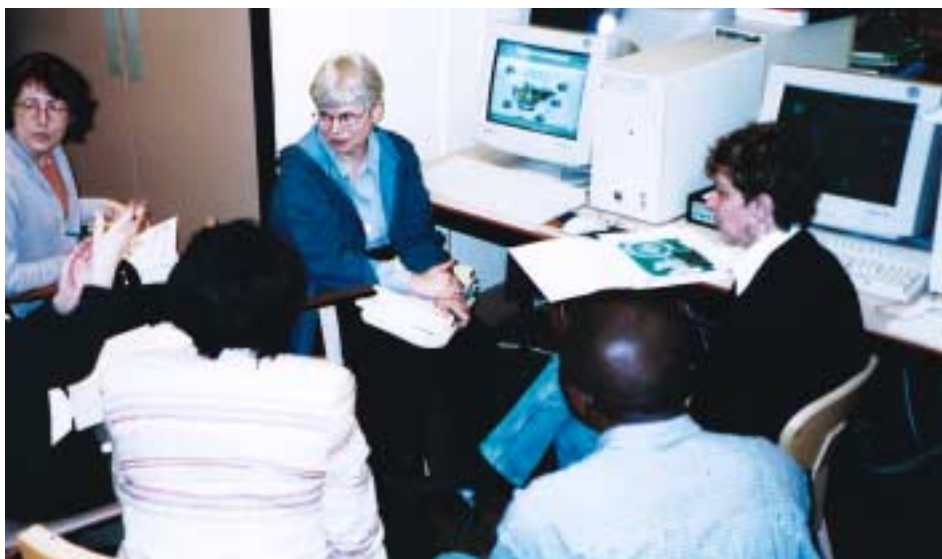
Le groupe de travail ALADIN débat du site électronique ALADIN. Institut international Coady, Antigonish, Canada, 12 avril 2002

Du 11 au 13 avril 2002, sept membres du groupe de travail ALADIN se sont réunis à l'Institut international Coady au Canada pour évaluer les expériences du réseau et analyser les questions générales le concernant, telles que les moyens de transformer le réseau en vivier de connaissances pour l'information sur l'éducation des adultes, ou de promouvoir et d'améliorer efficacement le réseau. La réunion avait pour but principal de concevoir un plan stratégique pour la formation de capacités au sein du réseau. Il a été convenu d'accorder des bourses à cinq membres ALADIN représentant chaque région, pour qu'ils assistent à la formation "Gérer les centres de référence des ONG" qui aura lieu du 12 mai au 6 juin 2003. L'objectif à moyen terme consiste à élaborer un guide de formation (en anglais,