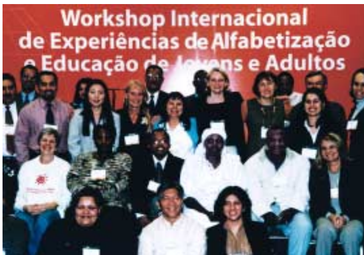
Rencontre du réseau de la Semaine internationale des apprenants adultes du 9 au 13 septembre à São Paulo, Brésil

Contact: Bettina Bochynek ( b.bochynek@unesco.org )