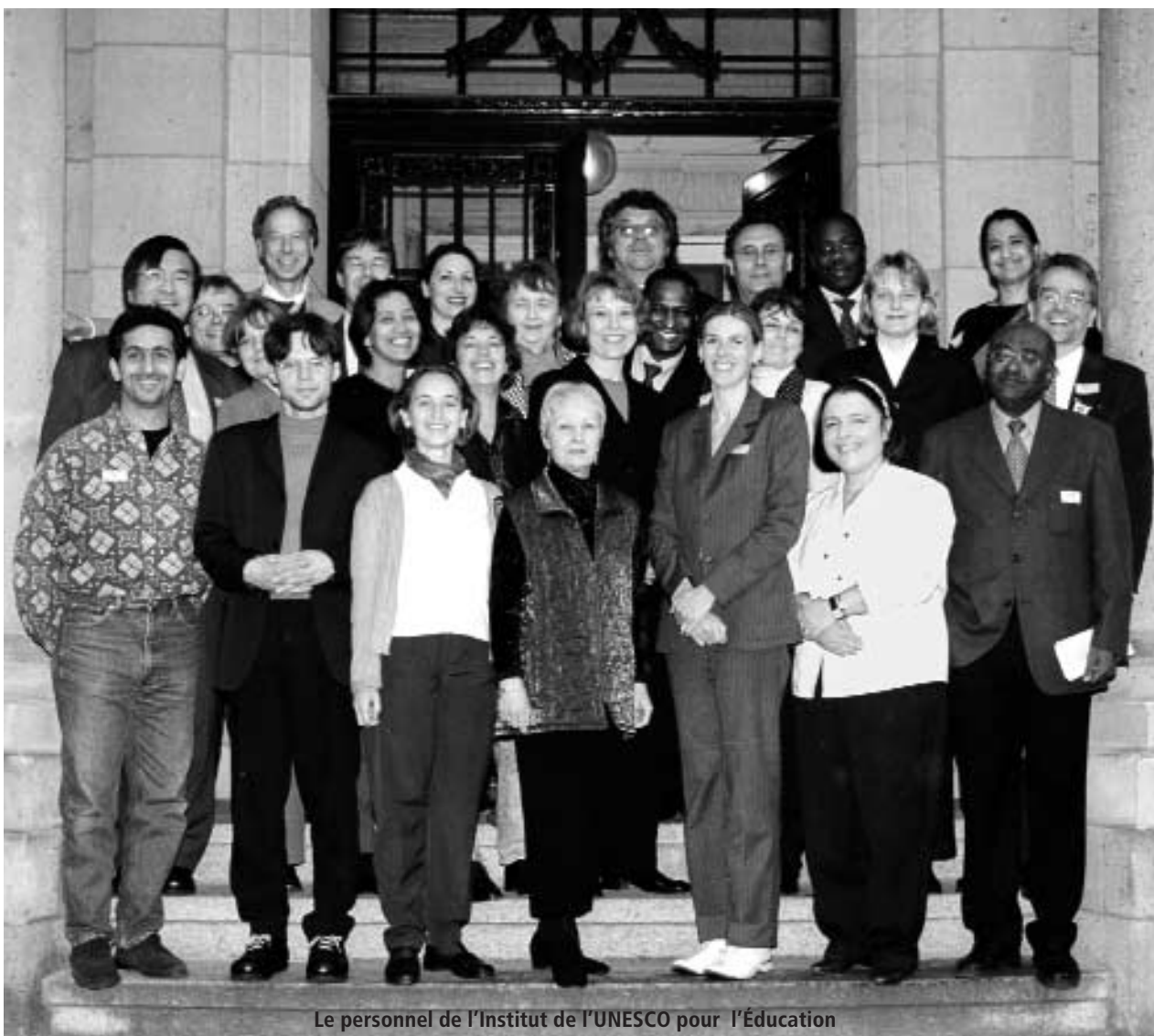
Le personnel de l'Institut de l'UNESCO pour l'Éducation

lé l'assise financière stable de l'Institut. Plusieurs mesures ont été entreprises pour compenser ces réductions, et des solutions à long terme sont en cours de négociation pour permettre à l'IUE de couvrir ses dépenses de personnel et de programme. Il a élargi la base de son financement en multipliant le nombre de ses partenaires financiers, et a en outre lancé un programme de prestations externes de consultation fournies à divers organismes. L'Institut devra réviser ses tarifs et chiffrer ses prestations à leur juste valeur, afin qu'elles fassent partie d'une stratégie durable de financement.