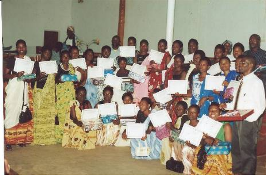
Photo 3 : Les lauréats de la coupe couture au centre formation en métier en 2006

On envisage de mettre en place 48 centres communautaires de documentation (community library of documentation) pour promouvoir la culture de la lecture dans l'esprit de tous rwandais.