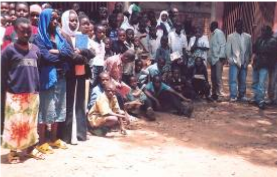
Photo 2 : Les jeunes qui fréquentent le centre de rattrapage de Gihundwe

Afin de faciliter la réintégration de nos lauréats alphabétisés à l'école primaire pour avoir la chance d'accéder à l'école secondaire et à l'université, le Projet a initié un Programme spécial de rattrapage (catch up) en collaboration avec le District/MINEDUC en Province de l'Ouest :