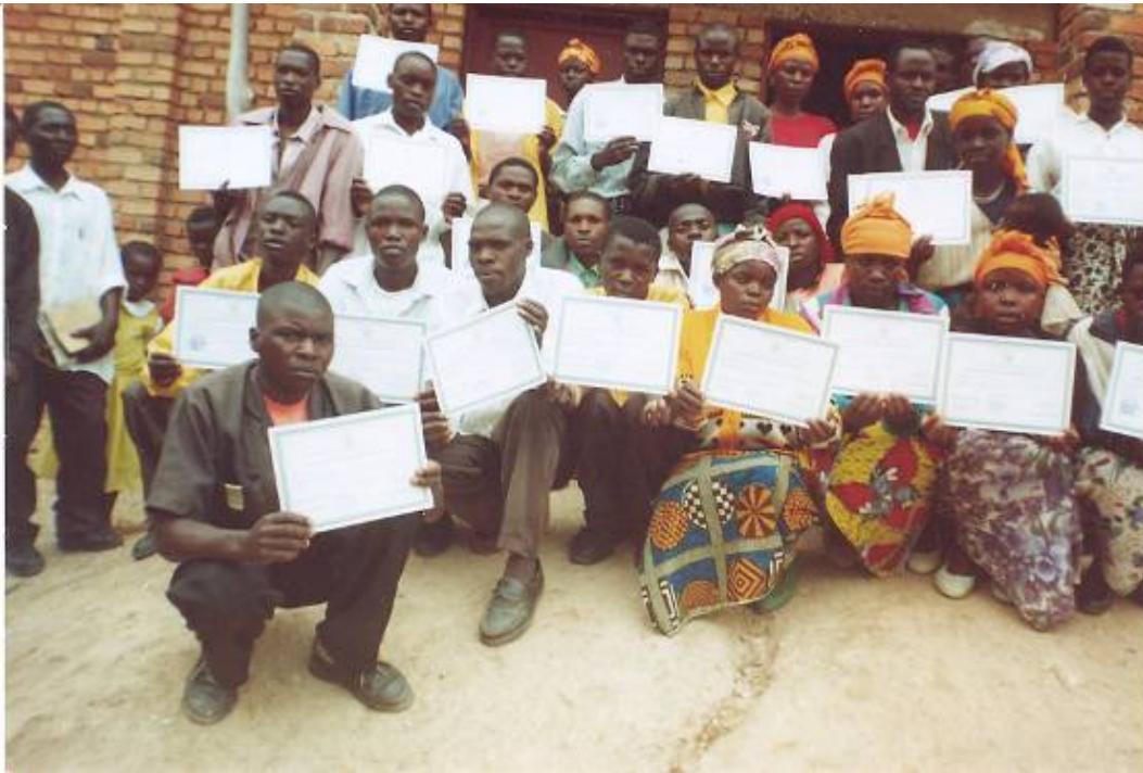
Photo 4 : Les lauréats alphabétisés reçoivent les certificats après 6 mois.