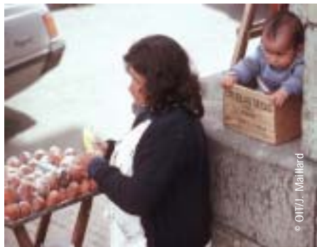
Vendeuse de pâtisseries dans les rues de Bogota, en Colombie

PENDANT les dix dernières années, l'accès à l'éducation de base s'est amélioré dans la majorité des pays d'Amérique latine et les inscriptions en secondaire, cycle dont l'achèvement est de plus en plus souvent requis pour accéder à l'emploi, avaient pratiquement atteint 70 % à la fin de la décennie. De graves problèmes persistent pourtant : trop de redoublants, des enfants trop âgés pour leur niveau, des compétences de base non acquises et des taux d'abandon trop élevés. Dans les familles les plus pauvres, le taux d'abandon des enfants et des adolescents est supérieur de 20 % environ à celui des familles plus aisées.