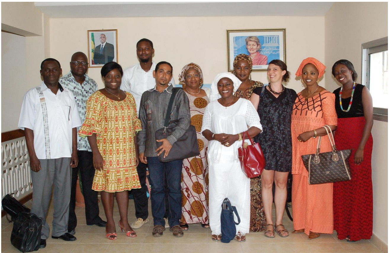
UNESCO Bureau Multisectoriel pour l'Afrique de L'Ouest Dakar, Sénégal