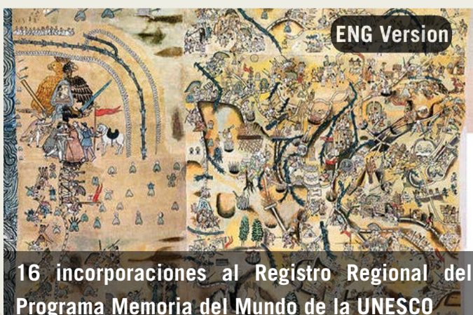
16 incorporaciones al Registro Regional del Programa Memoria del Mundo de la UNESCO