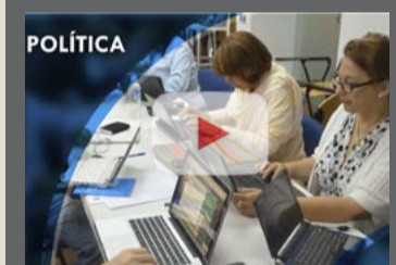
ABIERTA Y EN LÍNEA CAPACITACIÓN UNESCO Desigualdades en América Latina y el Caribe