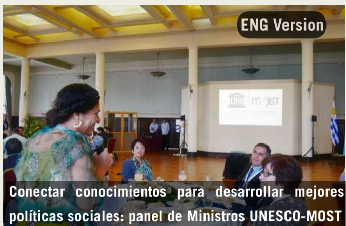
Conectar conocimientos para desarrollar mejores políticas sociales: panel de Ministros UNESCO-MOST