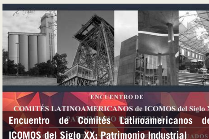
ENCUENTRO DE COMITÉS LATINOAMERICANOS de ICOMOS del Siglo X Encuentro de Comités Latinoamericanos de ICOMOS del Siglo XX: Patrimonio Industrial