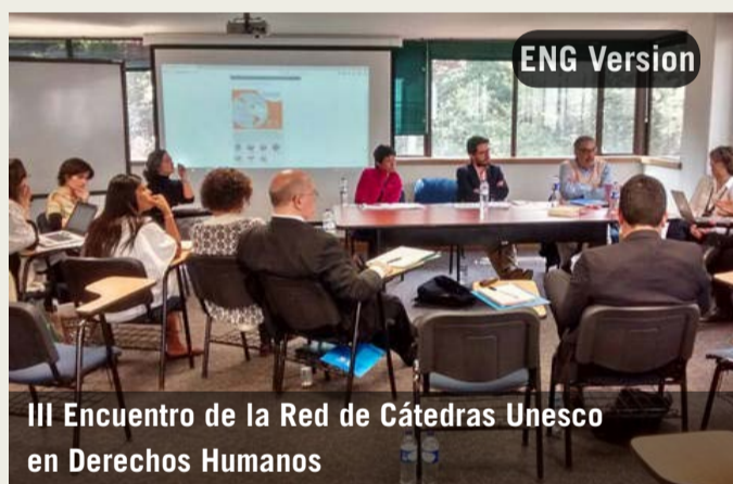
III Encuentro de la Red de Cátedras Unesco en Derechos Humanos