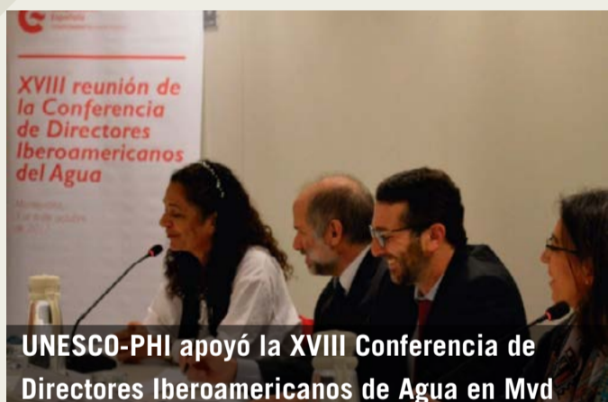
UNESCO-PHI apoyó la XVIII Conferencia de Directores Iberoamericanos de Agua en Mvd

En este día se celebra la forma en que las personas y las comunidades están reduciendo su riesgo frente a los desastres y aumentando el grado de sensibilización sobre la importancia de la Reducción de Riesgos de Desastres RRD.