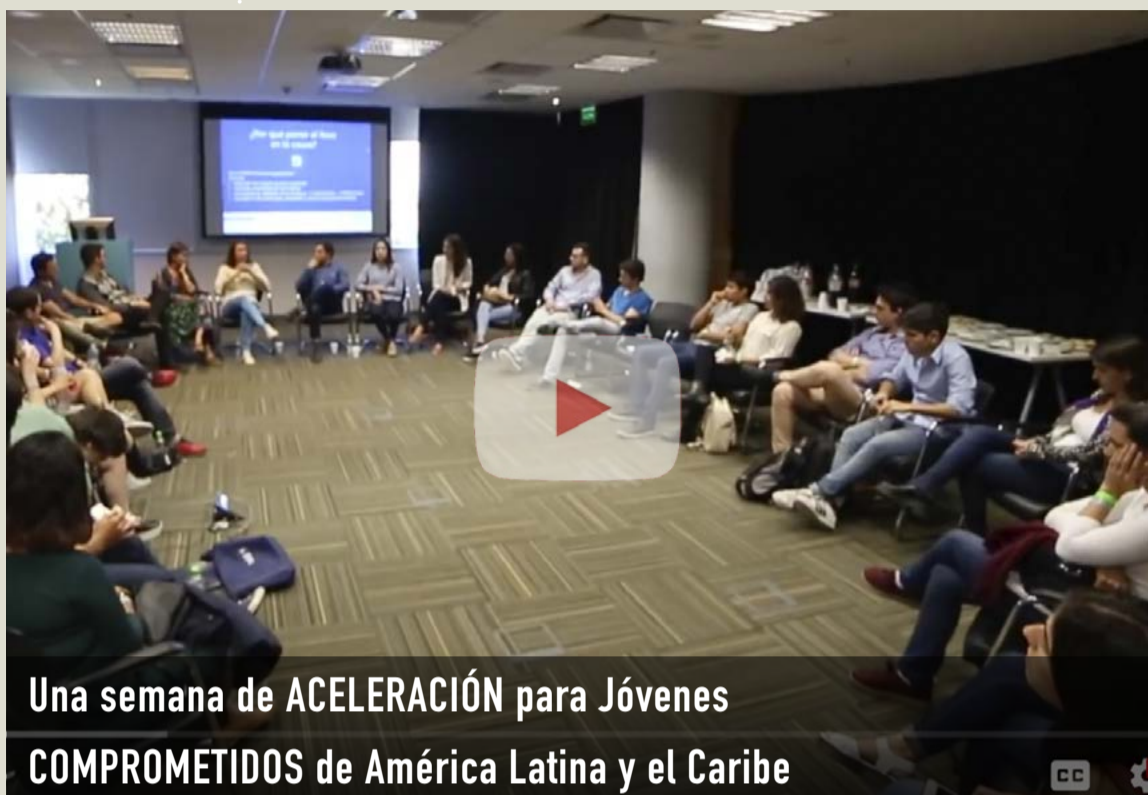
Una semana de ACELERACIÓN para Jóvenes COMPROMETIDOS de América Latina y el Caribe