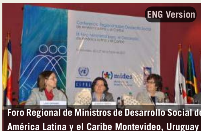
Foro Regional de Ministros de Desarrollo Social de América Latina y el Caribe Montevideo, Uruguay