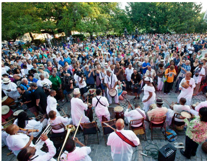
Sunrise Concert à la Nouvelle Orléans, 2012

L'UNESCO et les missions des Nations Unies, les Ambassades américaines et les représentations du gouvernement à travers le monde ont accueilli des événements spéciaux pour honorer cette forme d'art musical révéérée. L'UNESCO et le The Thelonious Monk Institute oeuvrent à promouvoir cette célébration auprès des universités, librairies, écoles, centres communautaires, salles de spectacle et les organismes artistiques de toutes disciplines autour du monde. Ces entités ont marqué la célébration à travers des concerts de Jazz, des ateliers, des séminaires, des tables rondes, des lectures, des jam sessions publiques, des master classes, des expositions de photos, des spectacles de danse, des projections de films et de documentaires, des représentations théâtrales et autres performances orales.