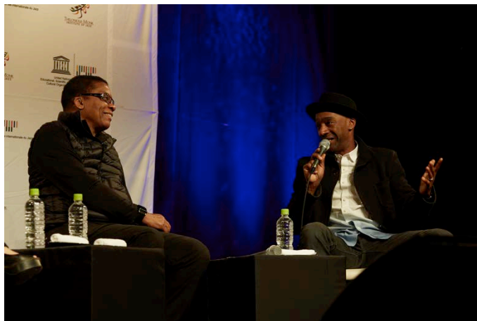
Les légendes du Jazz Herbie Hancock et Marcus Miller participent à un programme éducatif à Osaka (Japon)

En 2014, c'est Osaka, au Japon, qui a été la ville hôte de la Journée internationale du Jazz et qui a présenté une Journée entière de programmes éducatifs, incluant des master classes, des conférences, des panels de discussions, des jam sessions ainsi que des projections à l' Osaka School of Music . Cinq sessions ont été diffusées en direct via les sites jazzday.com et celui de l'UNESCO. La célébration a culminé par un extraordinaire All-Stars Concert auprès d'un public de plus de 10.000 personnes à l'historique Osaka Castle Park et qui a été diffusé en direct à travers le monde mais aussi enregistré pour diffusion par plusieurs stations de télévision publiques dans le monde.