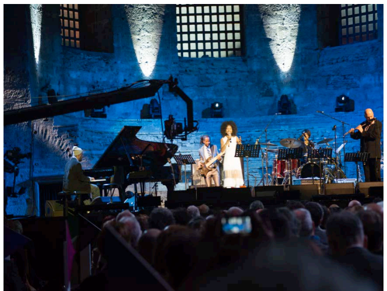
2013 "All-Stars Concert" dans l'historique Hagia Irene avec Robert Glasper, Esperanza Spalding, Terri Lyne Carrington et d'autres

En 2013, c'est Istanbul, en Turquie, qui a été la ville hôte de la Journée internationale du Jazz, présentant 40 programmes ainsi qu'une série de programmes éducatifs tout au long de la journée, conduits par des musiciens et des professeurs. Plus de 30 musiciens de renommée internationale ont participé au All-Stars Concert dans l'historique Hagia Irene d'Istanbul, diffusé en direct autour du monde via les Nations Unies, l'UNESCO et le Département d'Etat des Etats-Unis ainsi que le The Thelonious Monk Institute of Jazz . Le concert a été vu par plus de 60.000 habitants à Istanbul qui ont pu suivre le concert sur des écrans géants installés dans deux parcs publics enjambant les deux continents, dans une Community Square Live Simulcast .