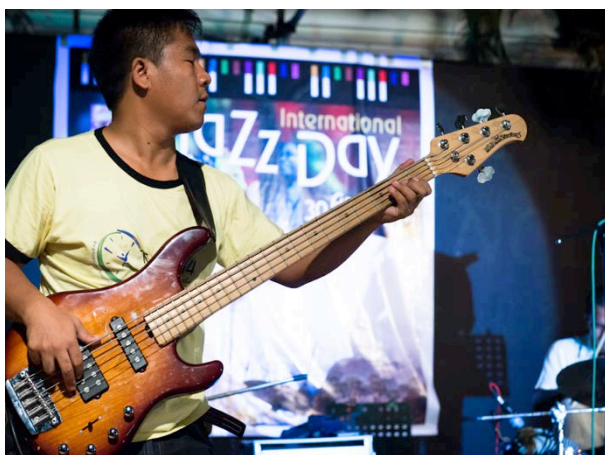
Un concert au Myanmar organisé avec l'Institut Français

Paris sera la ville hôte de la Journée internationale du Jazz 2015. Un concert "All-Star" ainsi qu'une journée entière de programmes éducatifs sur le Jazz à travers la ville et le Siège de l'UNESCO à Paris feront partie des événements d'envergure qui marqueront le 70 ème anniversaire de l'UNESCO.