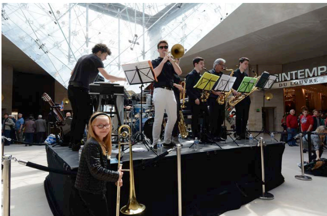
Un concert au Louvre (France) en 2014

Le Jazz est une forme d'art musical que l'on retrouve partout dans le monde. Depuis plus d'un siècle, le Jazz a contribué à apaiser et à élever les âmes de millions de personnes dans tous les coins du globe. La Journée internationale du Jazz est un moyen de mettre en lumière et de faire bénéficier les attributs fédérateurs de cette musique, à travers des événements et programmes festifs dans le monde, organisés le 30 Avril de chaque année.