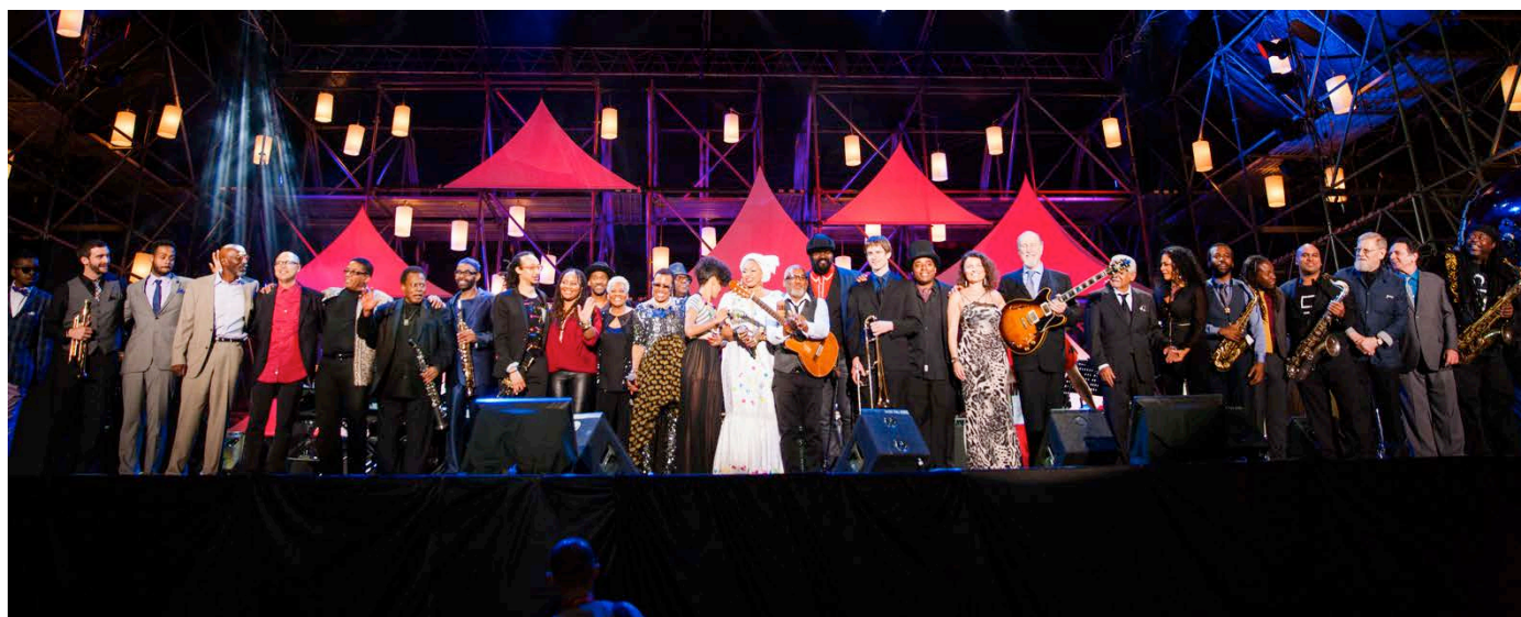
Les "Global All Stars", 2014