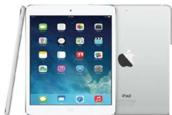
1 mini iPad