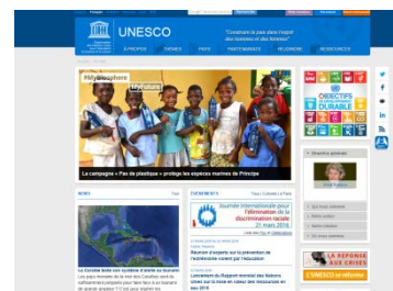
Reconnaissance internationale et visibilité de votre travail sur le site web de l'UNESCO

Frais de voyage et d'hébergement pris en charge par l'UNESCO.