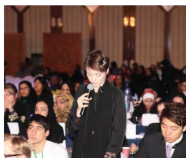
1 invitation à la "Seconde conférence internationale sur le bénévolat des jeunes : Prévenir l'extrémisme violent et renforcer l'inclusion sociale" à l'UNESCO, à Paris, 12-14 avril 2017