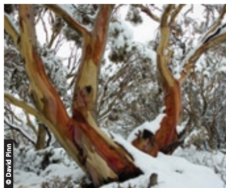
Deux snow gums à écorce rouge (Eucalyptus pauciflora). Exclusivement présents dans les régions alpines du sud-ouest de l'Australie, les snow gums sont particulièrement menacés par le changement climatique

La hausse des températures pourrait menacer la flore et la faune des rares espaces plus humides et plus élevés des Greater Blue