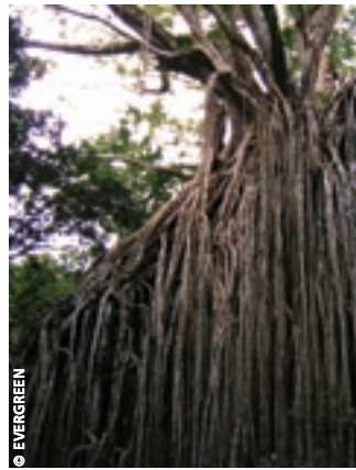
Ce figier étrangleur ( Ficus virens ) est l'un des plus grands arbres du nord tropical du Queensland. Il germe au sommet d'un autre arbre, et ce sont souvent les oiseaux qui en dispersent les graines. En poussant, il fait descendre ses racines jusqu'à étrangler son hôte. Cette adaptation donne au figier étrangleur un avantage certain par sa hauteur dans la compétition pour le soleil, qui ne brille qu'au-dessus d'une canopée très dense

la biodiversité et sur les fonctions des écosystèmes (terrestres et aquatiques), les effets de synergie sur les autres menaces comme celles des espèces invasives et les risques de feux de brousse pour les personnes et les biens.