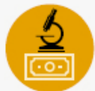
Figure 1.2 : Investissement dans la recherche-développement en pourcentage du PIB, par région et par pays, 2014 et 2018 (%)

Les données de 2014 sont indiquées entre parenthèses