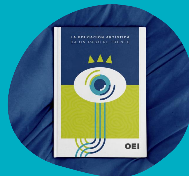
Presentación del "paper" La Educación Artística da un paso al frente