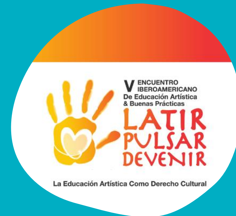
Encuentro Iberoamericano de Educación Artística y Buenas Prácticas